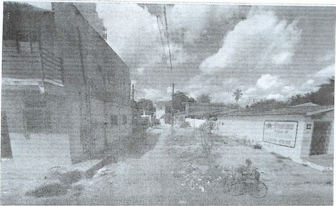
Final da Rua Bom Jesus, cruzamento com a Rua Flávio Maroja Filho, no bairro do Sesi